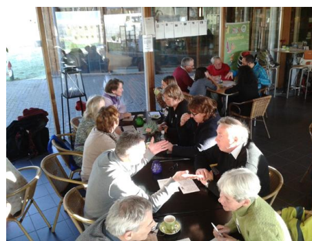
Speed-dating van de landschapsgidsen

In januari werd een netwerkbijeenkomst georganiseerd van de Nederlandse en Duitse gidsen uit de Meinweg en gidsen van de Nederrijn. Doel van deze bijeenkomst was van elkaar te leren en ervaringen uit te wisselen over de verschillende thema's voor grensoverschrijdende natuurgidsen. Dit gebeurde door speed-dating en door thematische excursies in kleine groepen.