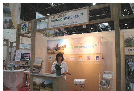
Jaarbeurs TourNatur in Düsseldorf