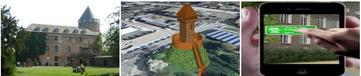
Cultuur ontmoet multimedia

Het Grenspark Maas-Swalm-Nette is voornemens de subsidieaanvraag voor het INTERREG V-A project „Cultuurgeschiedenis verdigitaald “ begin 2015 bij de euregio rijn-maas-noord in te