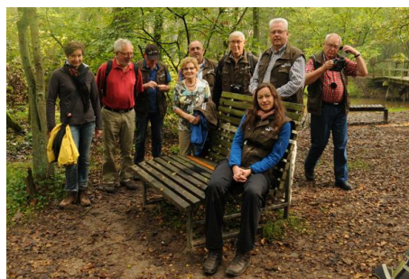
Bijeenkomst routescouts in Leudal/Haelen