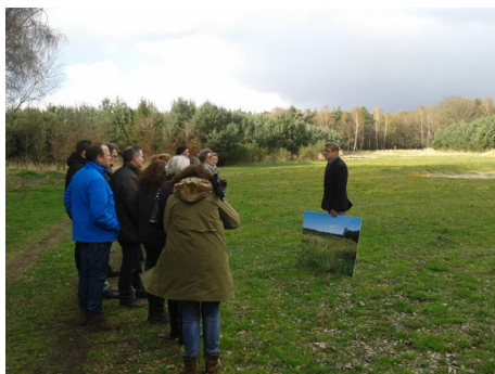
Cursus „ambassadeurs van het landschap“

IVN Limburg voert gefaciliteerd door de provincie Limburg, de voorlichting en de milieueducatie uit in nationaal park De Meinweg. Gebaseerd op de eerdere cursussen uit het project werd in samenwerking met IVN Limburg in 2014 ambassadeurs van het landschap geschoold. Aan de cursus van 10 tot 31 maart 2014 namen niet alleen gastronomen deel, maar ook ondernemers waarvan het bedrijf in de buurt van de Meinweg ligt of op thematisch gebied een relatie met de Meinweg hebben. Aan de cursus namen 10 Nederlandse en een Duits bedrijf deel. Ter afsluiting werd een netwerkbijeenkomst georganiseerd met alle in het INTERREG V-A project geschoolde ondernemers en gidsen om tot nieuwe gezamenlijke activiteiten te komen.