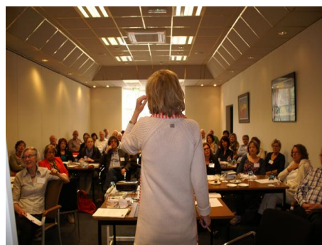
Netwerkbijeenkomst ondernemers en gidsen