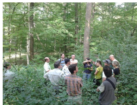
Excursie in jong eikenbos nabij Kehl

In 2013 werden in Wegberg-Arsbeck een aantal vroegere door het Britse leger gebruikte gebouwen gesloopt. Op verschillende andere plekken werden grotere opstanden met inheemse eiken beplant. In 2014 werd met beheerders en boswachters van het Nederlands-Duitse Meinweggebied deelgenomen aan een excursie „Natuurlijke verjonging van eikenbossen“. Doel van de excursie waren de resultaten te bekijken van een Frans-Duits INTERREG project van het bosbouwinstituut „Forstliche Versuchs- und Forschungsanstalt“ Baden-Württemberg en van de bosbouworganisatie „Office National De Forêts” in de Elzas. Ook werd een project voor de natuurlijke verjonging van eiken van de boswachterij Forstamt Lampertheim nabij Frankfurt bezocht. Zowel de Nederlandse als Duitse bosbouwers en beheerders namen nieuwe impulsen en positieve indrukken voor de grensoverschrijdende samenwerking mee naar huis.