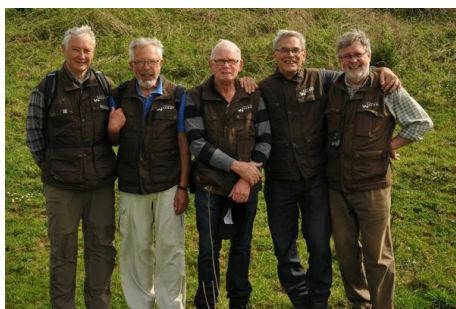
Bijeenkomst routescouts in Maasgouw/Stevensweert