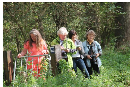
Perswandeling Rode Beek

Op 11 september werd in samenwerking met de VVV Midden-Limburg een perswandeling op de premiumwandelaroute Rode Beek georganiseerd. Journalisten en fotografen van de Rheinische Post en de Aachener Zeitung namen deel. Naar aanleiding van de wandeling verschenen twee krantenberichten. Door de uitgenodigde Nederlandse pers werd helaas niet deelgenomen.