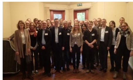
Deelnemers meeting

In het kader van het project werd op 6 november het internationale symposium „Green networks and natura 2000 across state borders” georganiseerd. Aan de bijeenkomst werd deelgenomen door 30 vertegenwoordigers van de deelstaten en provinciale overheden langs de Duits-Nederlands-Belgische grens. Doel van de bijeenkomst was de presentatie van de resultaten van het lopende project en de mogelijkheden voor grensoverschrijdende verbindingen van natuur en landschap binnen toekomstige projecten.