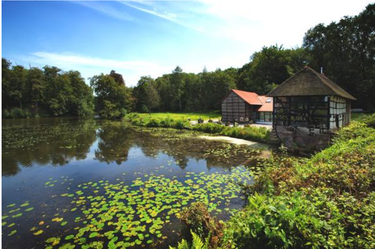
Tüschbroicher Mühle, Wegberg