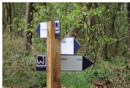
Bebording Premiumwandelmroute Meinvennen