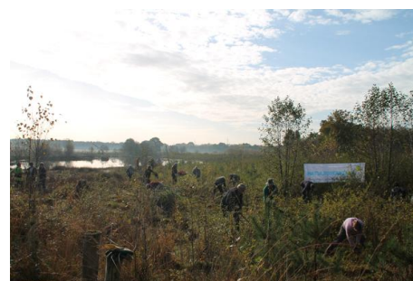
Heidebeheer Melicker Venn 2014

Op 2 november werd voor de tiende keer de binnen het INTERREG III-A project „Maas-Schwalm-Nette in de picture“ geïnitieerde, grensoverschrijdende natuurwerkdag georganiseerd. 30 vrijwilligers uit Nederland en Duitsland voerden gezamenlijke beheersmaatregelen uit in het Herkenbosscher Venn in nationaal park De Meinweg in de gemeente Roerdalen. De natuurwerkdag 2014 werd samen met Staatsbosbeer Regio Zuid georganiseerd en uitgevoerd.