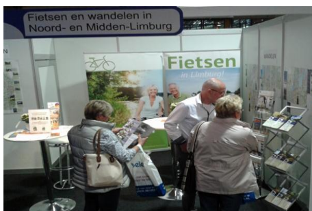
55+ jaarbeurs in Geleen

In 2014 werden op drie beurzen reclame gemaakt voor de premiumwandelaroutes. In het voorjaar nam het Grenspark deel aan gemeenschappelijke stands met de VVV Midden Limburg, Leisure Port en het Routebureau Noord- en Midden-Limburg in Nijmegen (10 april) en Geleen (23 mei). In de herfst nam het Grenspark MSN samen met twee vrijwilligers deel aan de stand van de Premiumwandelerwereld op de jaarbeurs TourNatur in Düsseldorf (5 tot 7 september). Premiumwandelerwereld is een samenwerkingsverband van 7 regio's in Duitsland met gecertificeerde premiumwandelaroutes die onder dit keurmerk samenwerken. Voor de Water.Wandel.Wereld is het Duitse Naturpark Schwalm-Nette inhoudelijk en financieel partner. Naar aanleiding van de TourNatur werd onder het keurmerk Premiumwandelerwereld in samenwerking met een wandelmagazine, de brochure premiumwandelaroutes gepubliceerd.