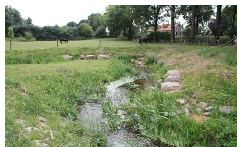
Beekherstel Vierlingsbeekse Molenbeek

Waterschap Peel en Maasvallei heeft in 2013 het beekherstel van de Lingsforterbeek afgerond. In samenwerking met de gemeente Venlo en de Stichting Limburgs Landschap werd daarbij het resterende traject van de beek opgeschoond en enkele oorspronkelijke meanders weer hersteld.