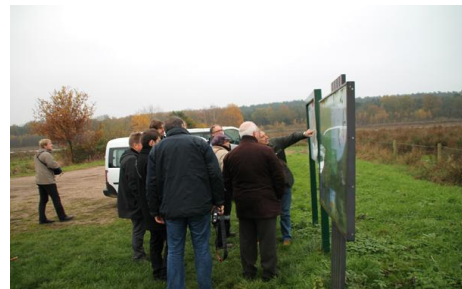
Excursie delegatie Meerlebroek, Beesel