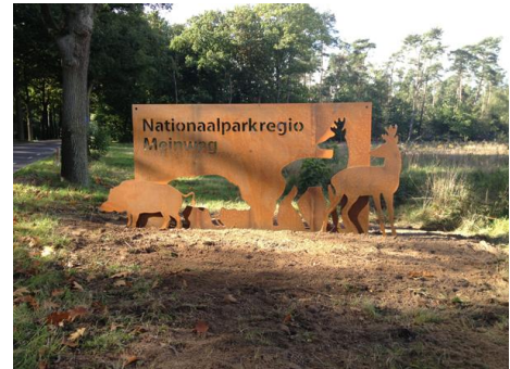
Locatie Swalmen, gemeente Roermond

In mei 2013 werd in Herkenbosch een Nederlands-Duitse workshop georganiseerd met het thema „afstemming, beheer en ontwikkeling van het Meinweggebied”. Centraal thema van de workshop was de mogelijkheden te onderzoeken op welke terreinen en in welke biotopen procesnatuur een belangrijkere rol kan spelen bij het toekomstig beheer. Tijdens de workshop werden door experts van beide kanten van de grens impulslezingen gehouden. De afstemming m.b.t. grensoverschrijdend beheer en ontwikkeling van natuurgebieden zal in de komende jaren worden voortgezet.