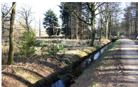
Monding Flugplatzgraben Elmpt voor

Het project Nagrewa werd eind 2012 met een half jaar verlengd om de nog niet afgesloten deelprojecten alsnog te kunnen realiseren. Tot op een deelproject van het Niersverband (ecologisch herstel van mondingen van zijbeken van de Niers) werden alle overige deelprojecten compleet uitgevoerd. In totaal werden binnen het project subsidiabele kosten van € 3,71 miljoen gerealiseerd (92% van de oorspronkelijk geplande kosten).