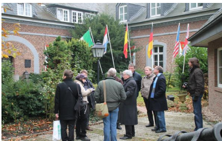
Ontvangst delegatie op kasteel Wassenberg