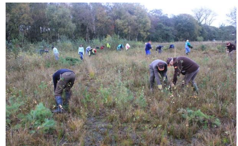
Heidebeheer tijdens de natuurwerkdag