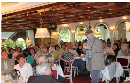
Afsluitende bijeenkomst met Hastenrats Will

Op 14 juni 2013 vond in Wassenberg de afsluitende bijeenkomst van het project plaats. De resultaten van het project werden gepresenteerd en op een amusante manier door de cabaretier Hastenrats Will van commentaar voorzien. Aan de afsluitende bijeenkomst namen 65 personen deel. De bijeenkomst werd met een wandeling en de officiële opening van de gerealiseerde uitkijkhut bij de Effelder Waldsee afgesloten.