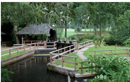
Vispassage Vierlingsbeekse Molenbeek

Het Schwalmverband realiseerde in 2013 in afstemming met o.a. het Biologisch Station Krickenbecker Seen het ecologisch herstel van de monding van de Flugplatzgraben in de Swalm. Waterschap Aa en Maas heeft in het voorjaar 2013 de maatregelen rond de Vierlingsbeekse Molen en de bouw van de vispassage rond de molen afgesloten.