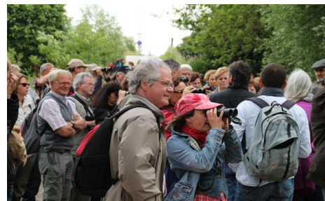
Excursie Millinger Waard

In samenwerking met het Nationaal Park De Meinweg, Staatsbosbeheer en het IVN Consulentenschap Limburg werd in april 2013 de MeinWeg-brochure gepubliceerd. Daarin werden bijzondere attracties van de Nationaalparkregio en de aan het project deelnemende gemeenten gepresenteerd. Ook werden activiteiten en evenementen voor bezoekers en toeristen opgenomen.