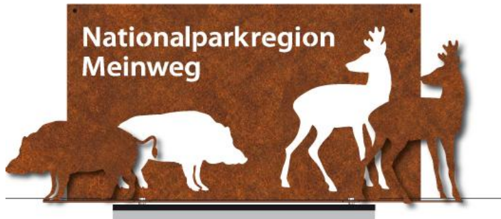
Toegangspoort Nationaalparkregio Meinweg

Ook werden op invalswegen naar het gebied 12 zogenaamde „toegangspoorten“ geplaatst, zij wijzen het wegverkeer er op dat men de Nationaalparkregio MeinWeg nadert.