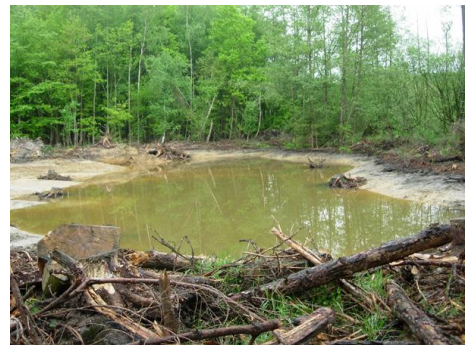
Poel bij de Raky Weiher in Wegberg

In het voorjaar 2013 werd naast de Raky-Weiher in de gemeente Wegberg een nieuwe poel aangelegd als voortplantingswater voor amfibieën en met name de kamsalamander. In het Nationaal Park De Meinweg kon op basis van het opgestelde poelenplan in 2013 in samenwerking met de beheerder Staatsbosbeheer meer dan 25 poelen worden opgeschoond en hersteld. Op eigendomsgronden van de gemeente Roerdalen in het Nationaal Park De Meinweg werden de heidevennen Bakven en Vlodropperven hersteld en verbeterd.