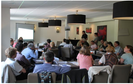
Bijeenkomst TransParcNet in hotel Asselt