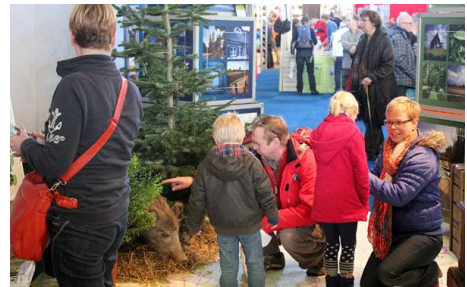
Wandel- en fietsbeurs in Amsterdam

In het voorjaar 2013 werd naast de Raky-Weiher in de gemeente Wegberg een nieuwe poel aangelegd als voortplantingswater voor amfibieën en met name de kamsalamander. In het Nationaal Park De Meinweg kon op basis van het opgestelde poelenplan in 2013 in samenwerking met de beheerder Staatsbosbeheer meer dan 25 poelen worden opgeschoond en hersteld. Op eigendomsgronden van de gemeente Roerdalen in het Nationaal Park De Meinweg werden de heidevennen Bakven en Vlodropperven hersteld en verbeterd.