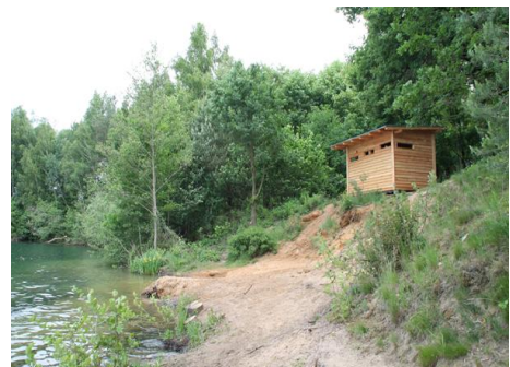
Uitkijkhut Effelder Waldsee