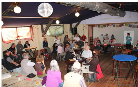
Bijeenkomst Niederrhein- en Meinwegguides

Onder de supervisie van de NABU Naturschutzstation Kranenburg werd in de afgelopen jaren in de regio Beneden Niederrhein ook grensoverschrijdend natuurgidsen opgeleid. Om een netwerk van natuurgidsen langs de Nederlands-Duitse grens tussen NRW en de provincies Gelderland en Limburg te vormen, brachten de Meinweg-Guides in juni 2013 een bezoek aan de Niederrhein Guides. Doel van de bijeenkomst was de wederzijdse kennismaking en de inhoudelijke uitwisseling van ervaringen. Tijdens de gezamenlijke excursie werd de Millinger Waard bij Nijmegen bezocht.