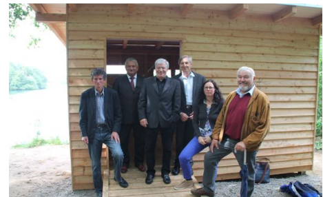
Opening uitkijkhut bij de Effelder Waldsee

Het project werd met de inhoudelijke eindrapportage en de door de accountant goedgekeurde financiële eindrapportage aan de euregio rijn-maas-noord afgesloten. Inmiddels is de eindbeschikking van de certificeringautoriteit IV A ontvangen.