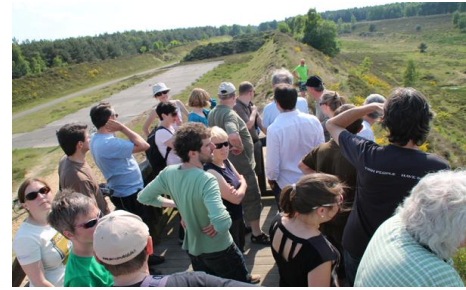
Excursie in het natuurgebied Brachter Wald