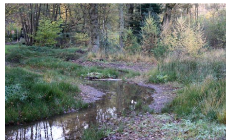
en na herstel

Het Schwalmverband realiseerde in 2013 in afstemming met o.a. het Biologisch Station Krickenbecker Seen het ecologisch herstel van de monding van de Flugplatzgraben in de Swalm. Waterschap Aa en Maas heeft in het voorjaar 2013 de maatregelen rond de Vierlingsbeekse Molen en de bouw van de vispassage rond de molen afgesloten.