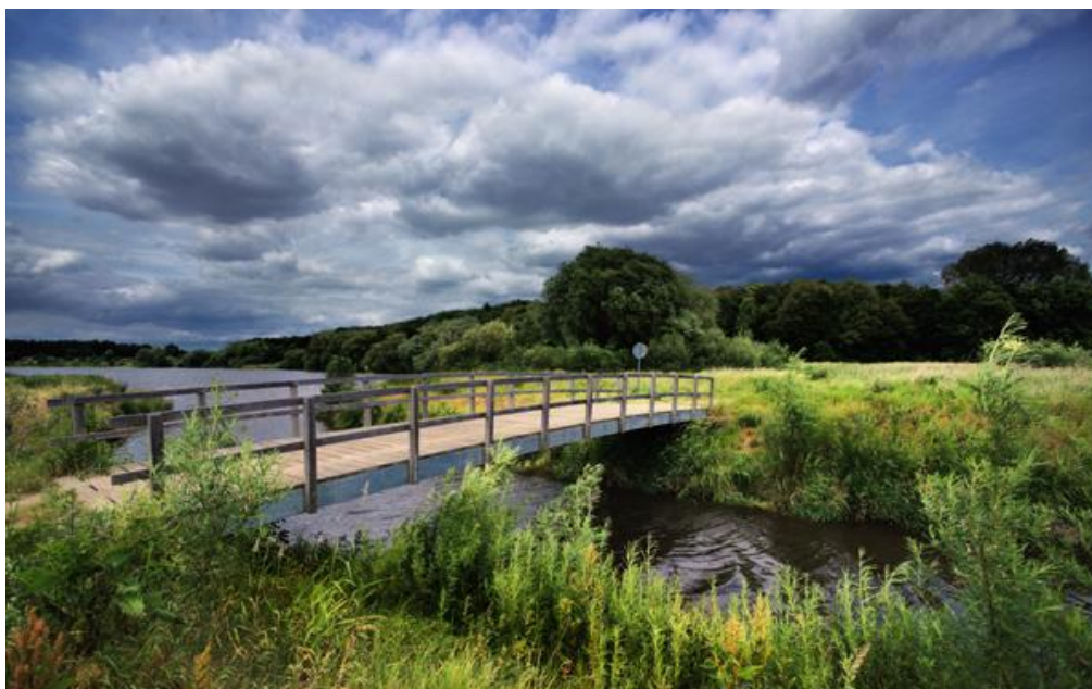
Swalm tussen Swalmen en de monding in de Maas

Het conceptjaarverslag 2013 zal op 30 april 2014 ter vaststelling aan het algemeen bestuur worden aangeboden.